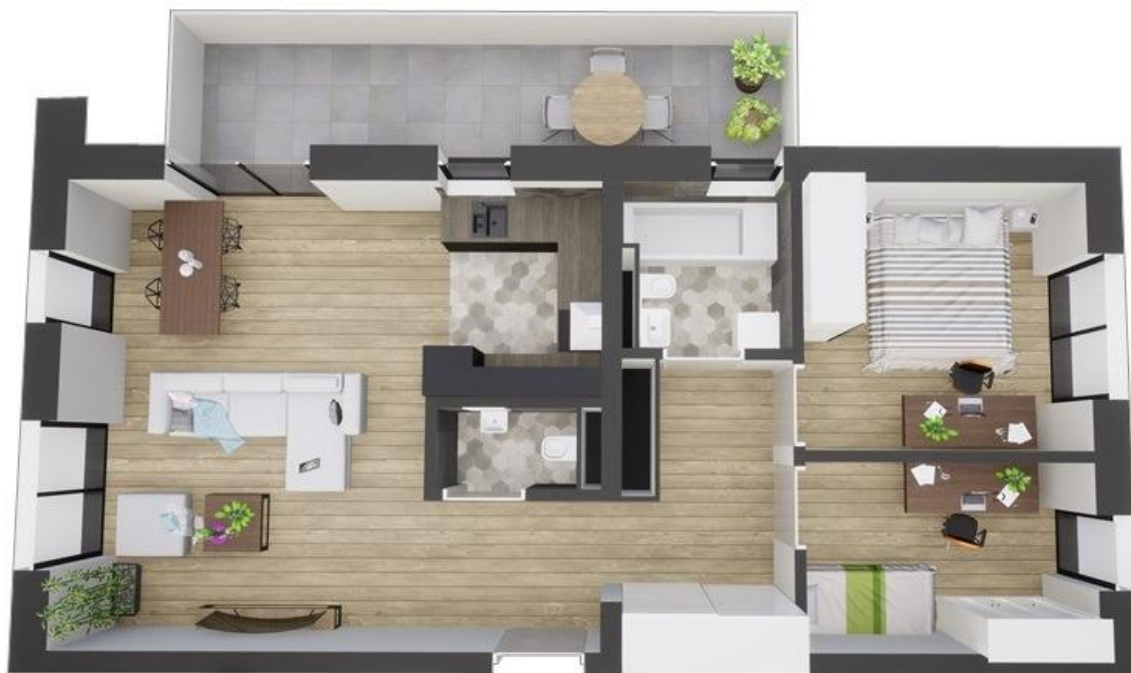
MIESZKANIE WIDOK WNĘTRZA PERSPEKTYWA