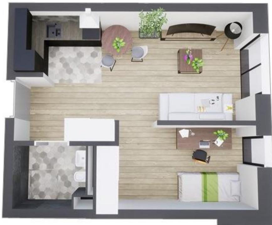
MIESZKANIE WIDOK WNĘTRZA PERSPEKTYWA