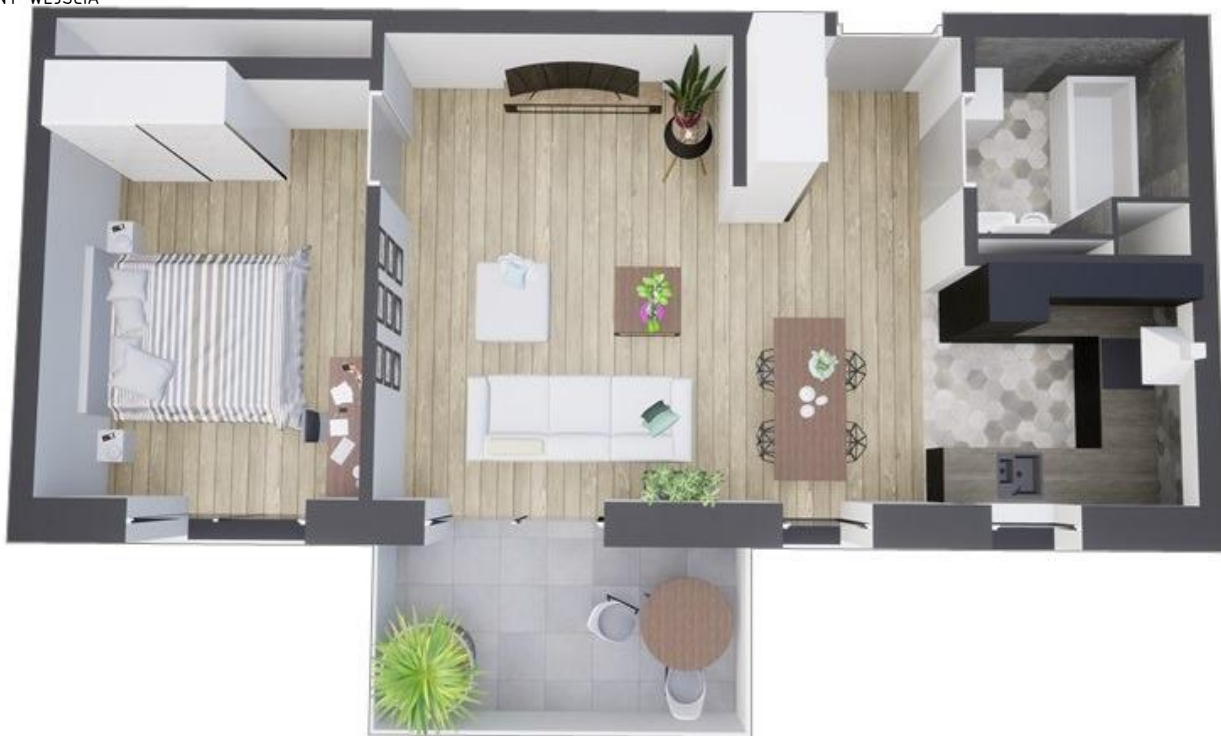
MIESZKANIE WIDOK WNĘTRZA PERSPEKTYWA