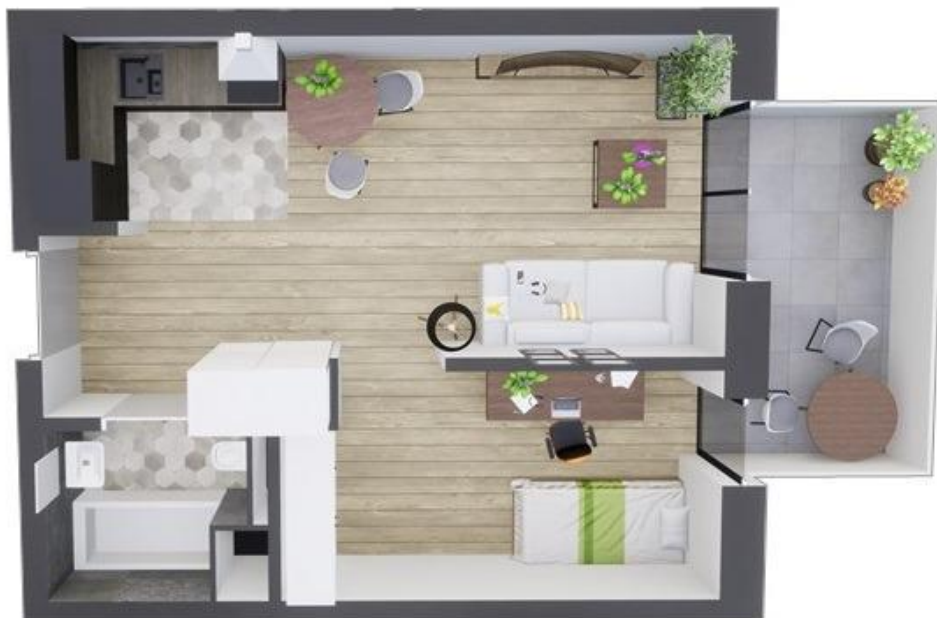
MIESZKANIE WIDOK WNĘTRZA PERSPEKTYWA