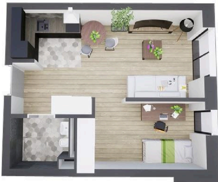
MIESZKANIE WIDOK WNETRZA PERSPEKTYWA