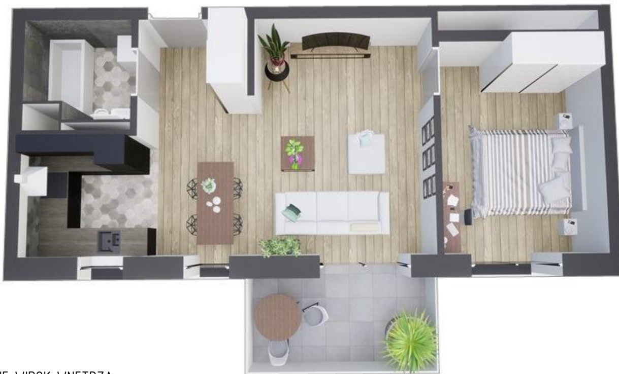
MIESZKANIE WIDOK WNĘTRZA PERSPEKTYWA