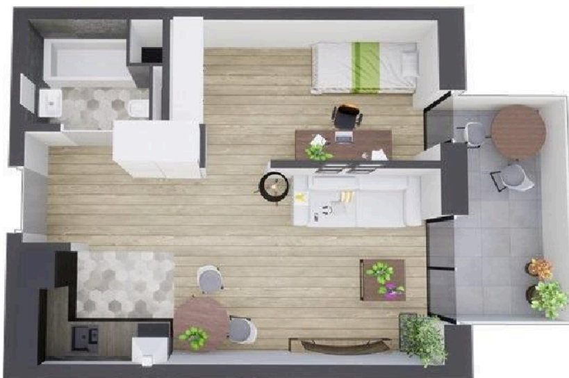
MIESZKANIE WIDOK WNETRZA PERSPEKTYWA