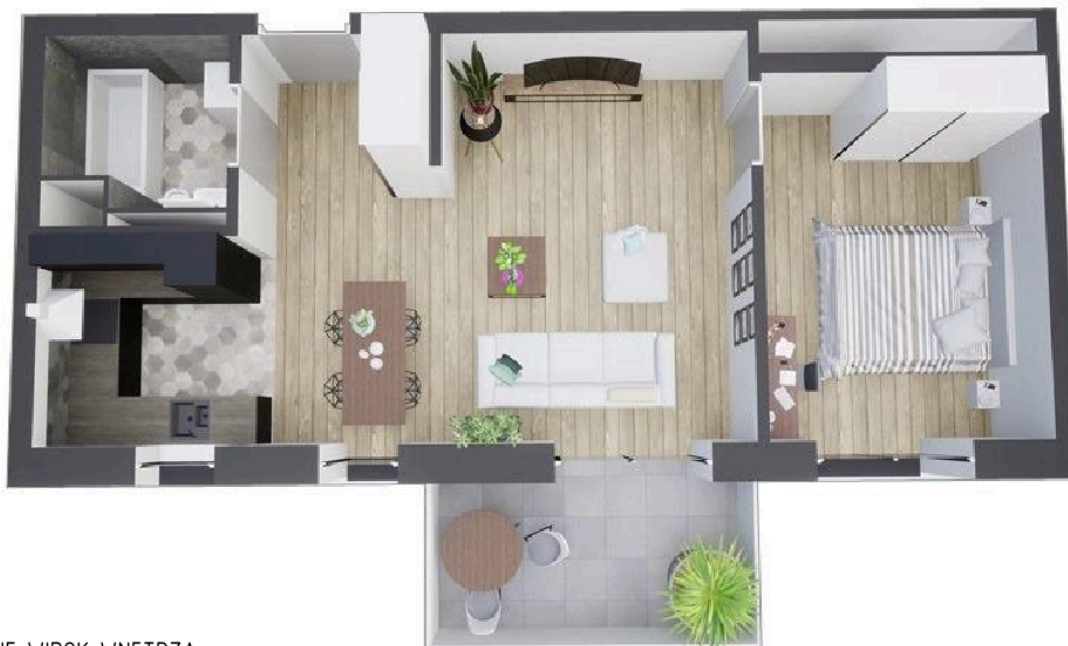
MIESZKANIE WIDOK WNETRZA PERSPEKTYWA