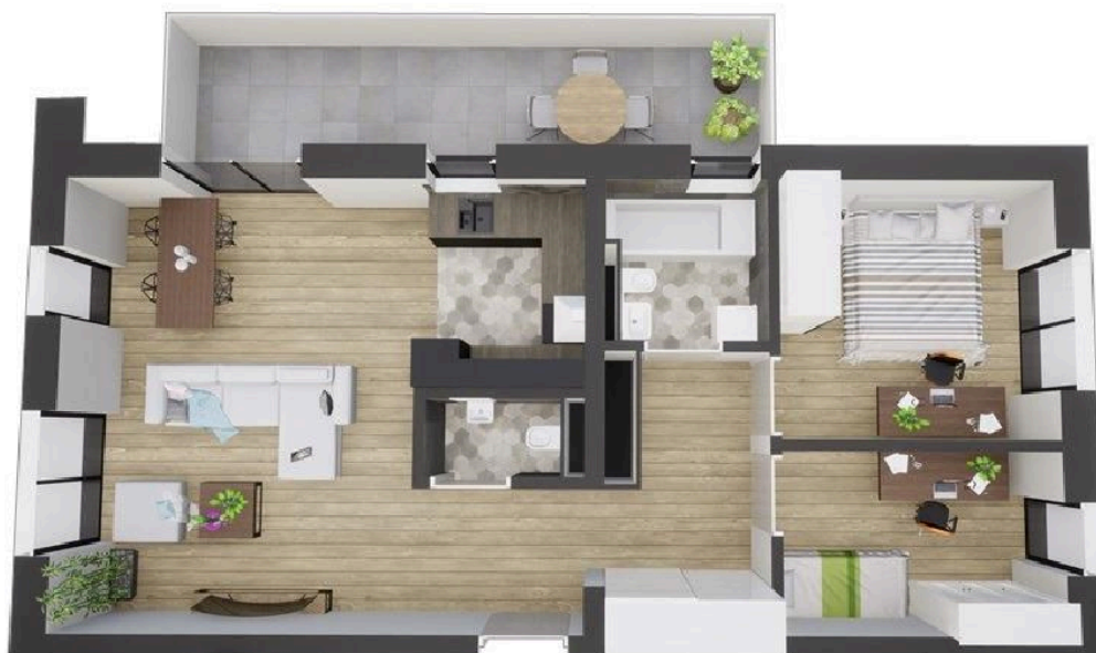
MIESZKANIE WIDOK WNETRZA PERSPEKTYWA