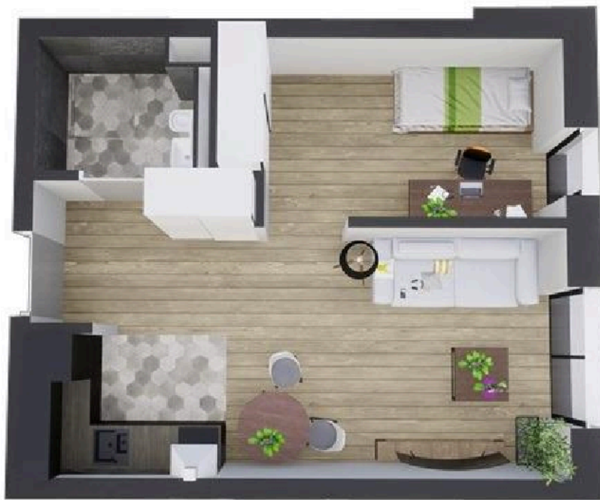
MIESZKANIE WIDOK WNĘTRZA PERSPEKTYWA