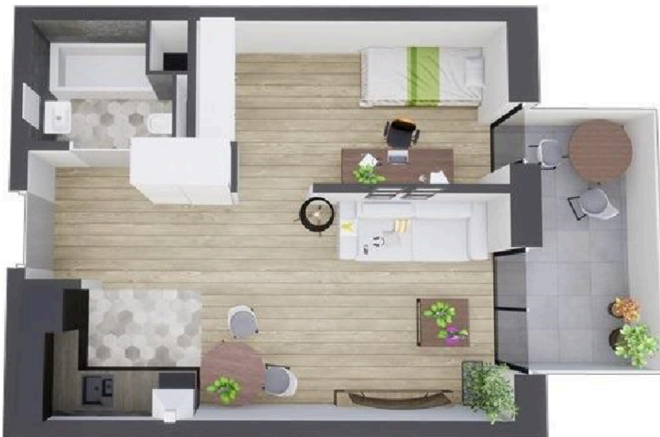
MIESZKANIE WIDOK WNĘTRZA PERSPEKTYWA