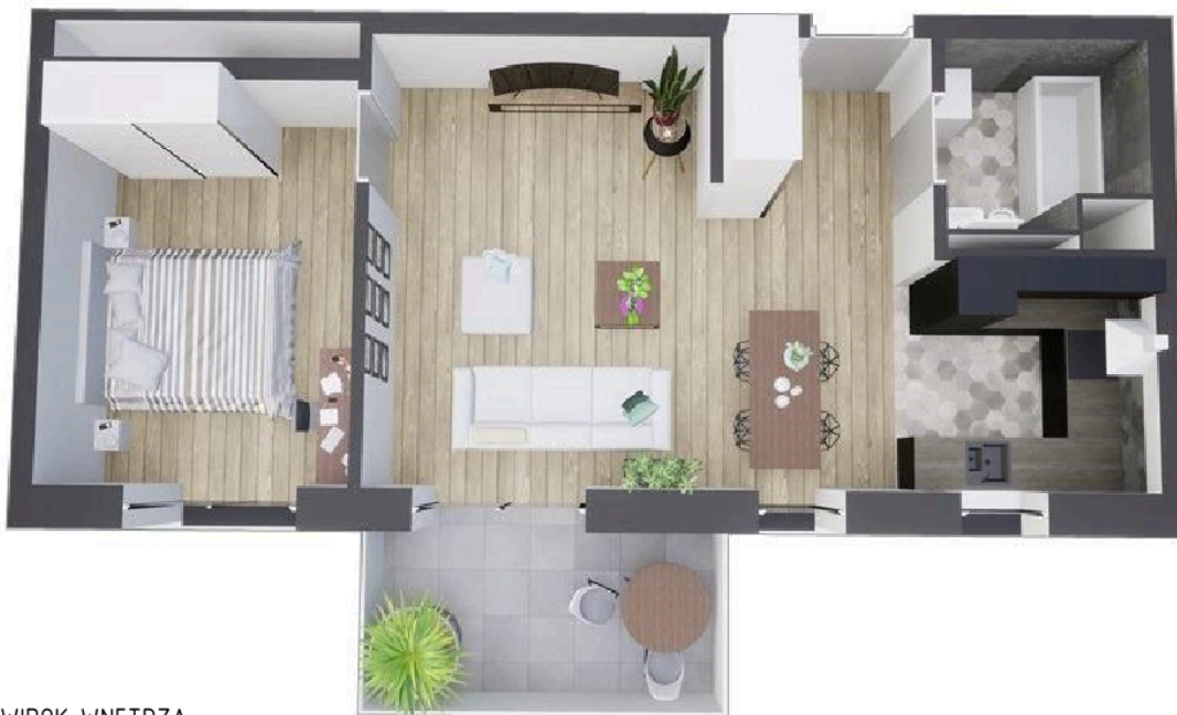
MIESZKANIE WIDOK WNĘTRZA PERSPEKTYWA