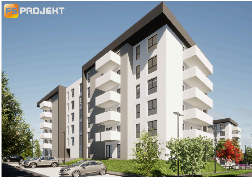
BUDYNEK NR 2 WIDOK OD STRONY WEJŚCIA