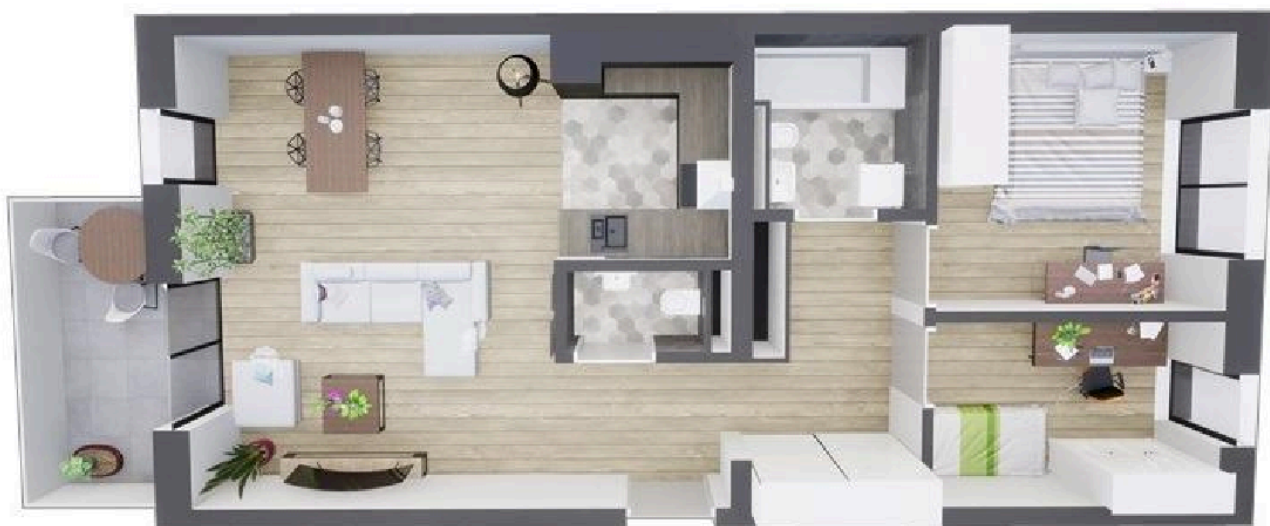
MIESZKANIE WIDOK WNĘTRZA PERSPEKTYWA