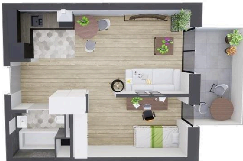
MIESZKANIE WIDOK WNETRZA PERSPEKTYWA