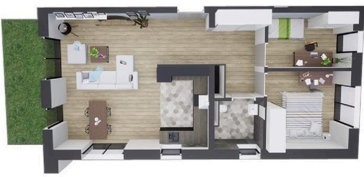
MIESZKANIE WIDOK WNĘTRZA PERSPEKTYWA