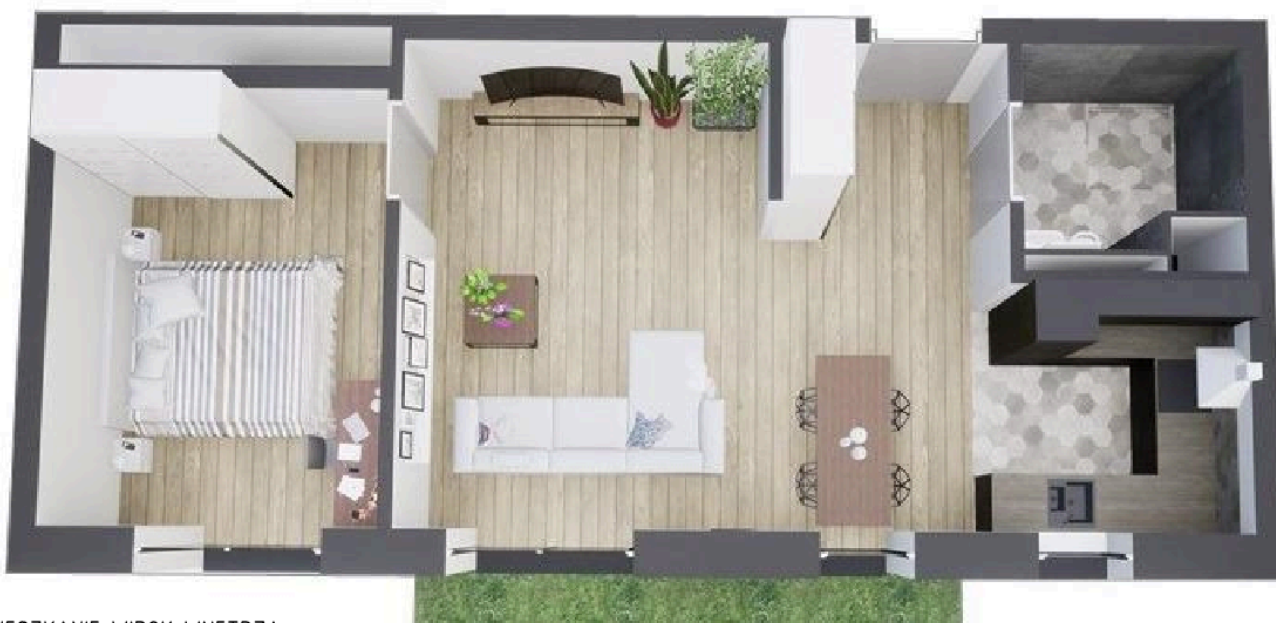
MIESZKANIE WIDOK WNETRZA PERSPEKTYWA