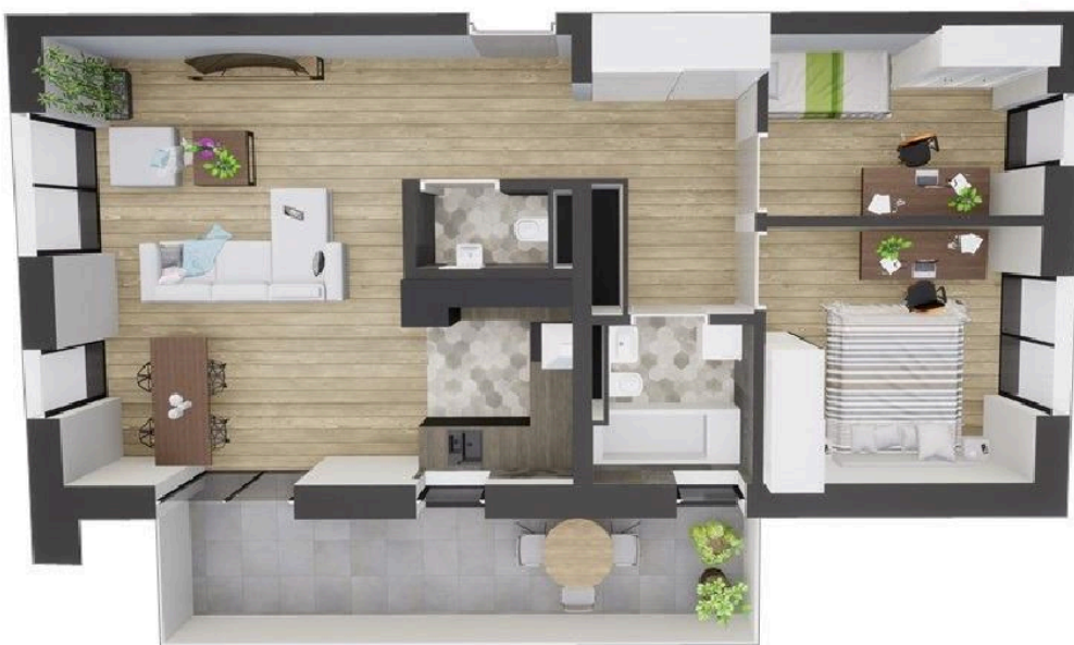
MIESZKANIE WIDOK WNETRZA PERSPEKTYWA