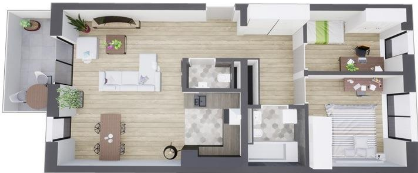
MIESZKANIE WIDOK WNĘTRZA PERSPEKTYWA