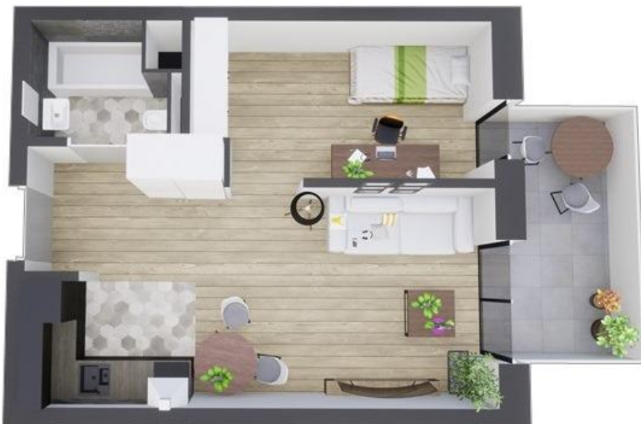
MIESZKANIE WIDOK WNĘTRZA PERSPEKTYWA