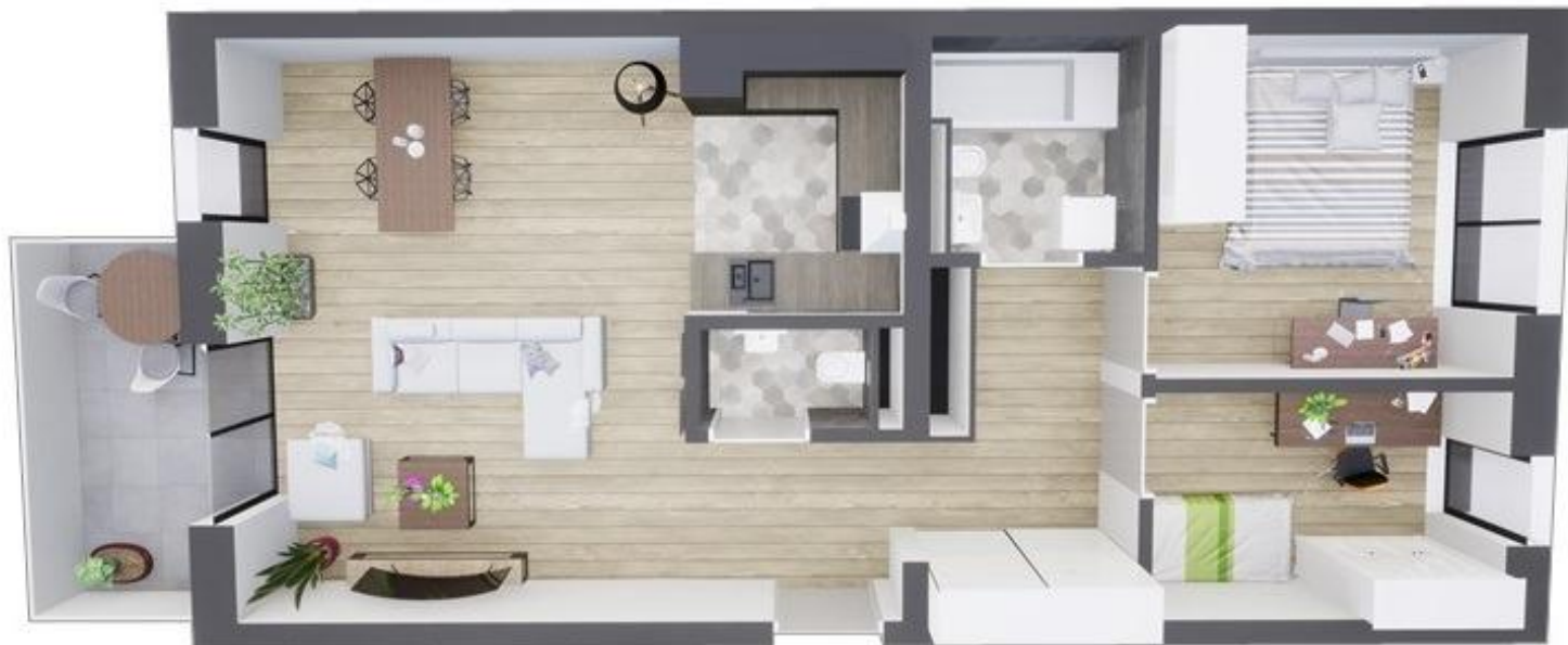
MIESZKANIE WIDOK WNĘTRZA PERSPEKTYWA