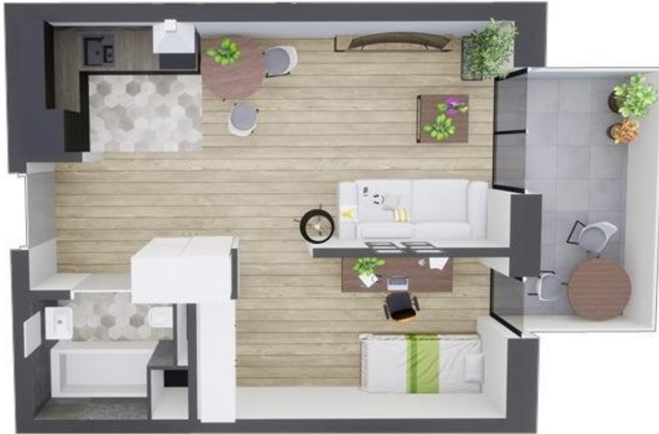
MIESZKANIE WIDOK WNĘTRZA PERSPEKTYWA