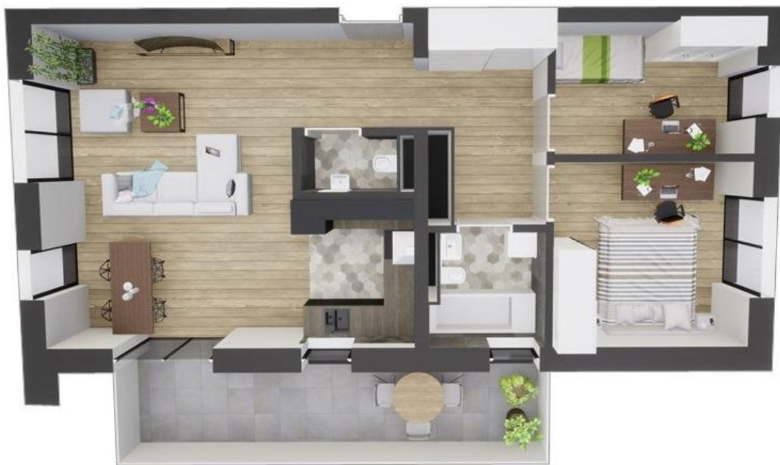
MIESZKANIE WIDOK WNĘTRZA PERSPEKTYWA